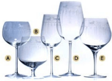
R.D. Vintage : Olive & Horse

12.00 น. รับประทานอาหารกลางวันที่ร้านคุณแดง 13.30 น. เดินทางไป โรงงานผลิตภัณฑ์เครื่องแก้ว โลตัสคริสตัลที่ อ.ปลวกแดง จ. ระยอง ซึ่งมีผลิตภัณฑ์ที่มีลวดลายสวยงามและ ประณีตให้เลือกซื้อตามอัธยาศัย